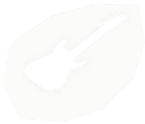
GTR Elec : Stéphane DAIREAUX