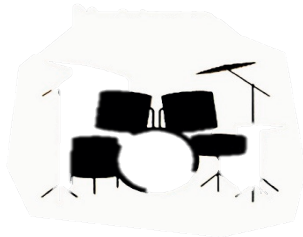
Batterie : Hervé KOSTER